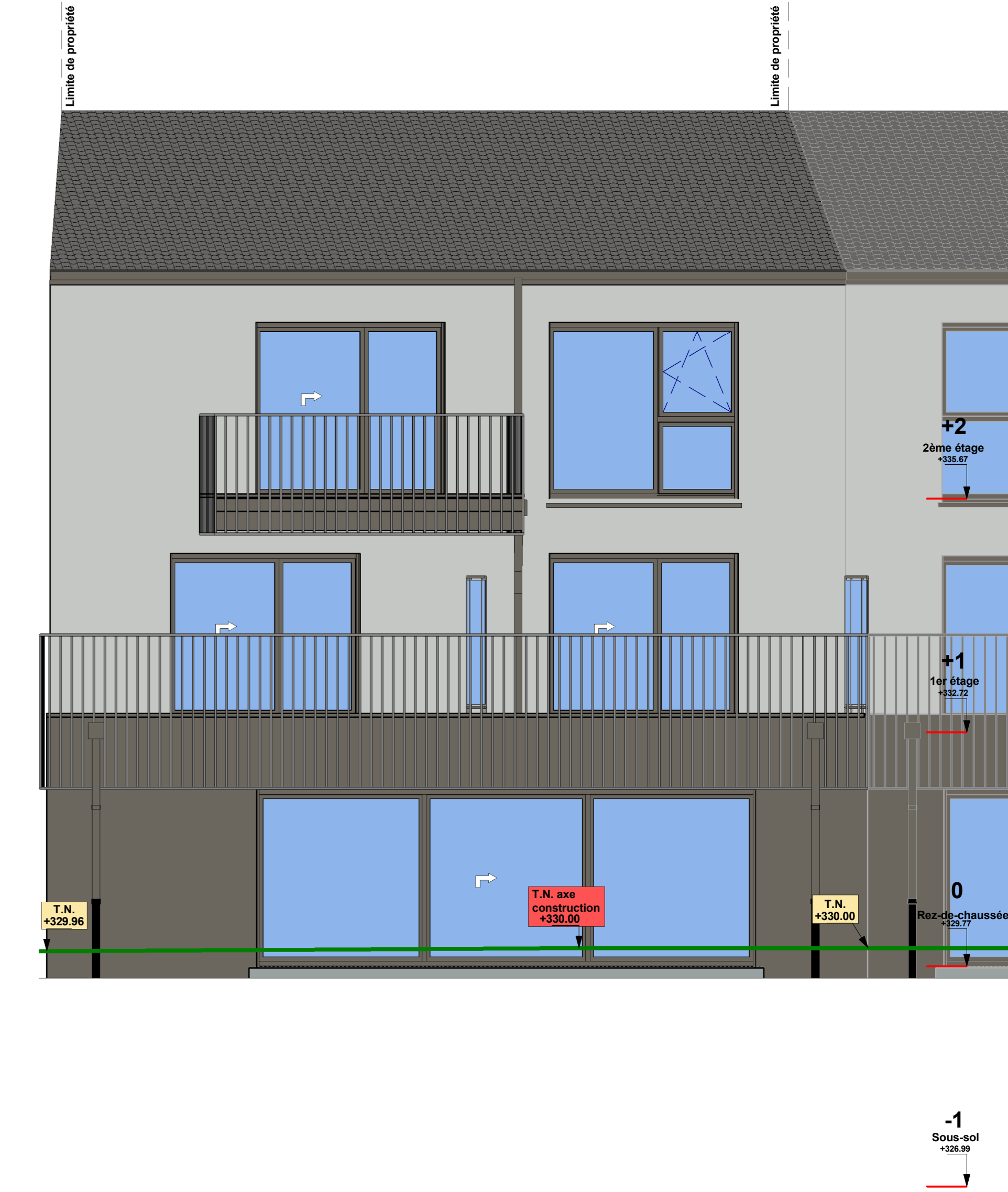
6 C8. Façade arrière Ech. : 1 : 50