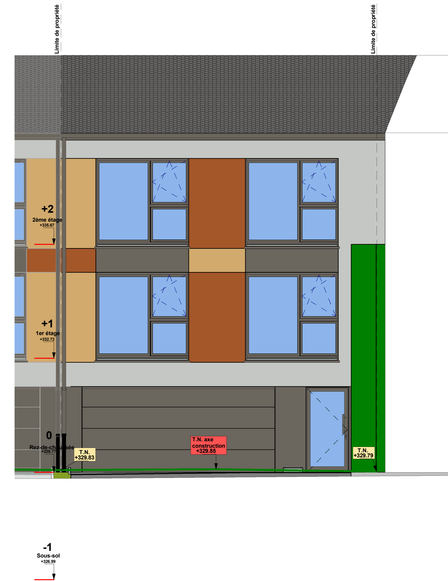
5 C7. Façade avant Ech. : 1 : 50