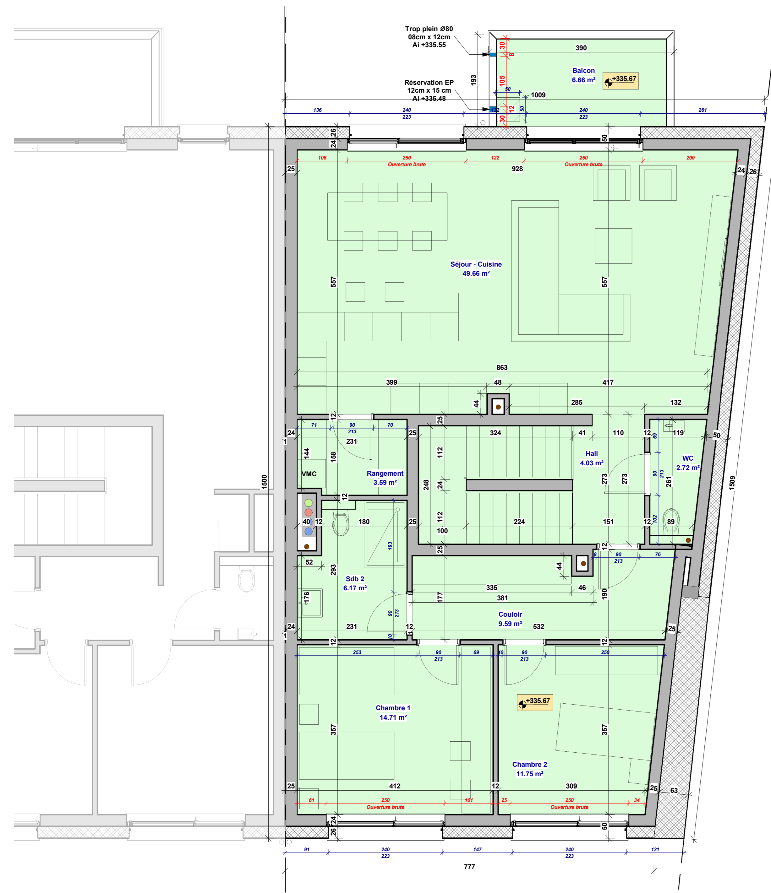
2 C.4 2ème étage Ech. : 1 : 50